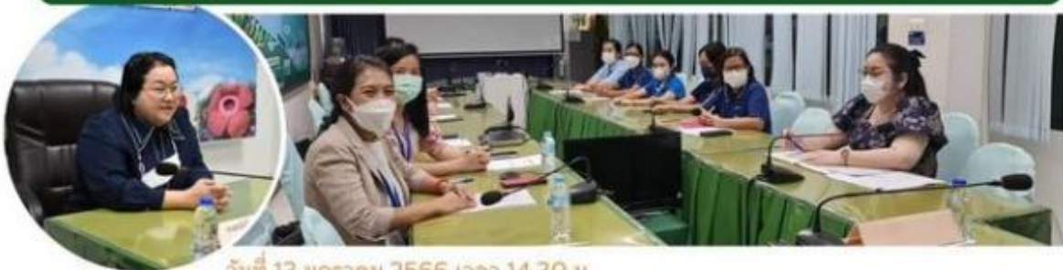
วันที่ 13 มกราคม 2566 เวลา 14.30 น.

สนง.เกษตรและสหกรณ์จังหวัดสุราษฎร์ธานี และ สนง.เศรษฐกิจการเกษตรที่ 8 ร่วมแลกเปลี่ยนเรียนรู้ ระบบติดตามผลการดำเนินงาน และการติดตามภาวะเศรษฐกิจการเกษตรด้วยเทคโนโลยีผ่าน Google Online